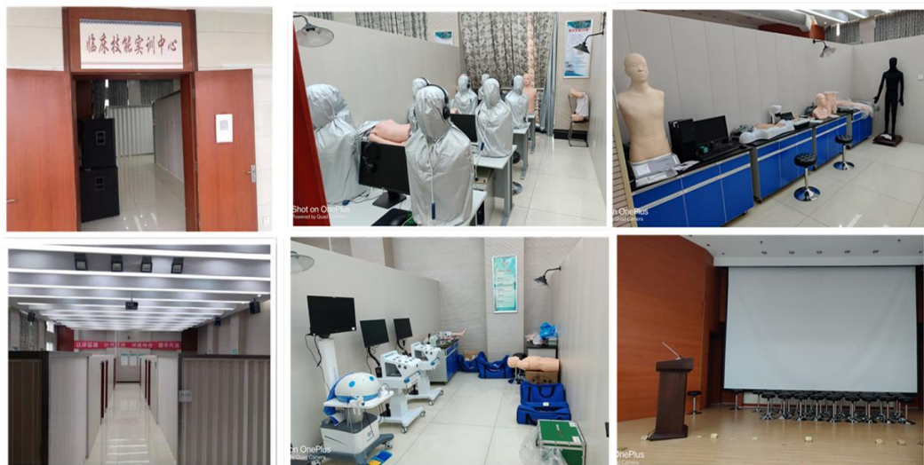
临床技能实训中心

作为安徽中医药大学附属医院，教学机构健全，设有专门的教学管理部门和教研室，教学师资 100 余人、硕士生指导老师 12 人。技能培训设备设施齐全。